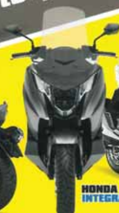
HONDA INTEGRA 750